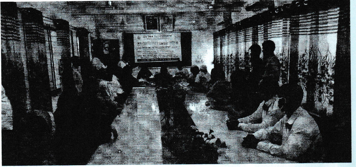
চিত্র: ১৭ সেপ্টেম্বর, ২০২২ তারিখে কাহালু উপজেলা কার্যালয়, বগুড়ায় সুশাসন প্রতিষ্ঠার নিমিত্তে স্টেকহোল্ডারগণের সমন্বয়ে অবহিতকরণ সভা।