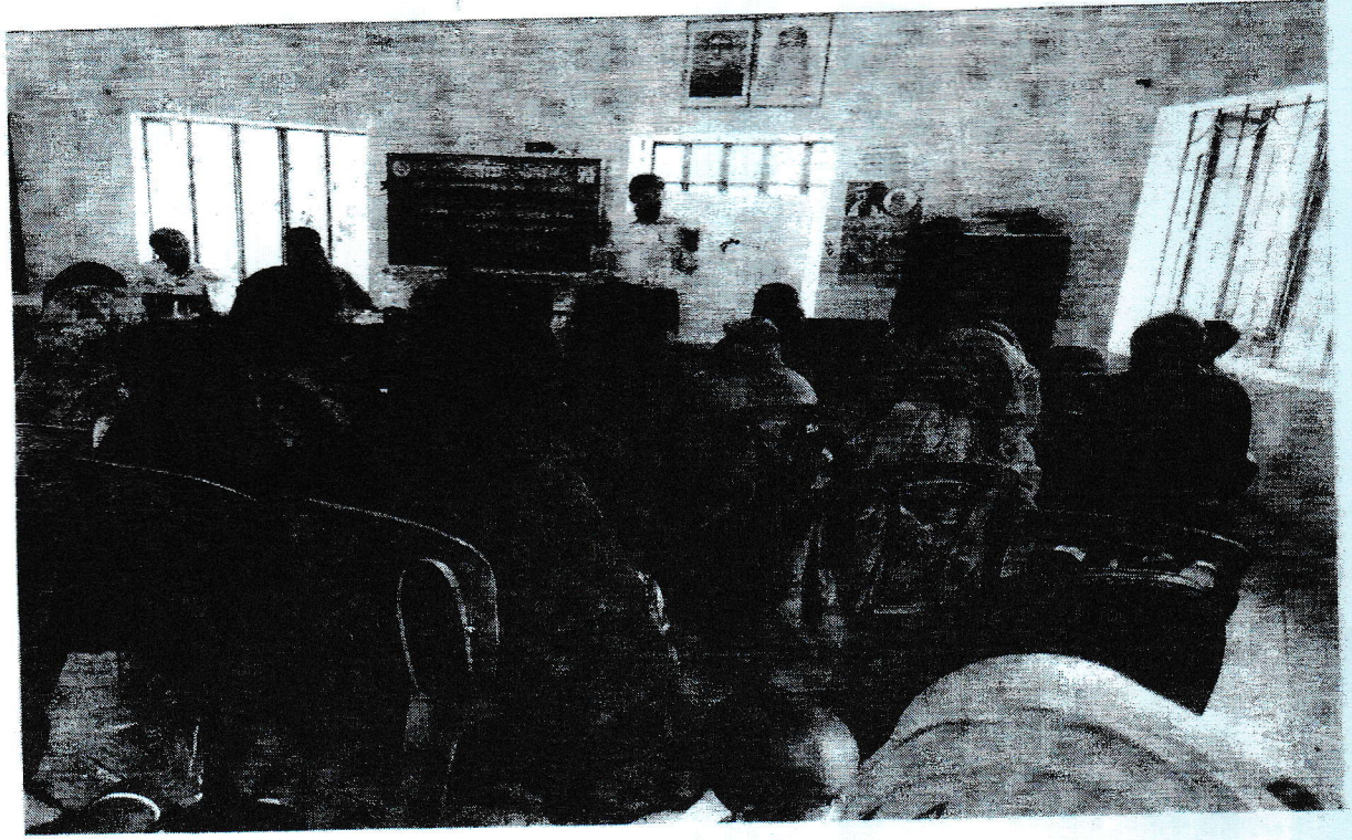
চিত্র: কোটালীপাড়া উপজেলা কার্যালয়ে গোবাদিপশু ও হাঁস-মুরগী প্রতিপালনের উপর প্রশিক্ষণ কোর্স