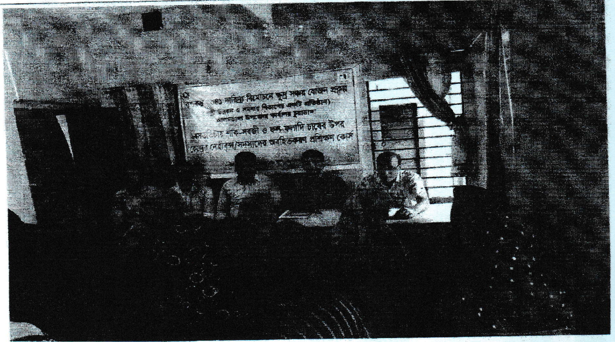
চিত্র আলমডাঙ্গা উপজেলা কার্যালয়ে বসতিভিত্তিক শাক সবজি ও ফলফলাদি চাষের উপর প্রশিক্ষণ কোর্স